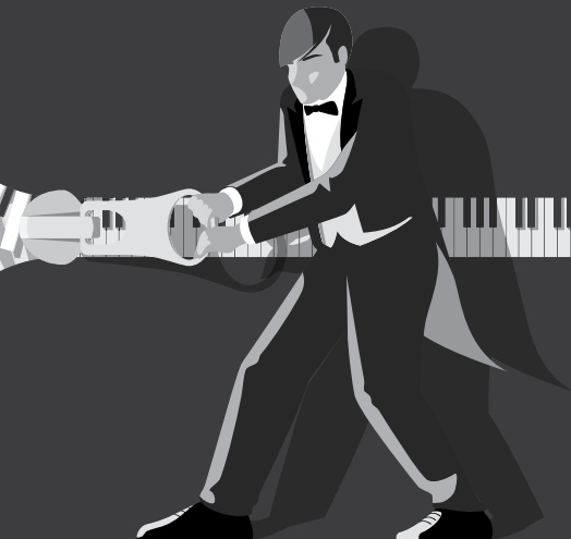
Illustrazione video canzoni | progetto grafico @manducensis